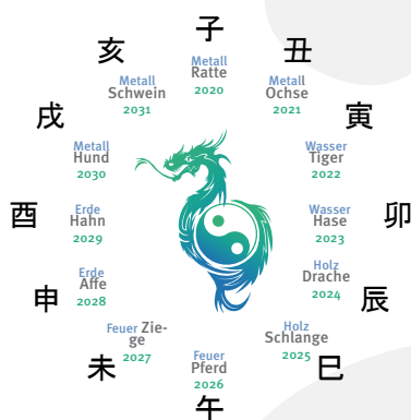
Die Himmelsstämme und 12 Erdzeichen im Chinesischen Tierkreis der Jahre 2020 bis 2031. c) bei Ursula C. Brunner, München, (Grafik Sandro Lindner)

Jedes Jahr bestimmen Himmelsstämme und Erdzweige die Qualitäten auf unserer Erde. Die Himmelsstämme sind durch die fünf chinesischen Elemente gekennzeichnet: Holz * Feuer * Erde * Metall * Wasser * und die Erdzweige werden durch die 12 Tiere des Tierkreises repräsentiert.